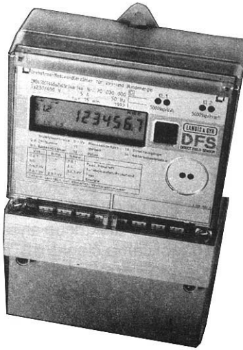
SLIKA 1: IZGLED BROJILA